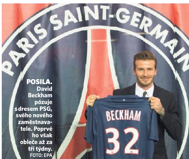
POSILA. David Beckham pózuje s dresem PSG, svého nového zaměstnavatele. Poprvé ho však obleče až za tři týdny.

Ale další jména budou v následujících dnech určitě přibývat.